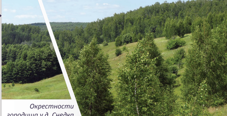
Окрестности городища у д. Снедка

Здесь сохранились виды животных, растений и грибов, характерные как для широколиственных лесов засечно-го типа, так и для северной лесостепи. Многие из них являются редкими и нуждающимися в охране и занесены в Красные книги.