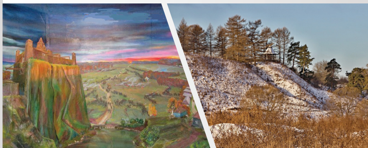
Диарама «Одоев крепость Большой засечной черты»

Одоевское городище (Соборная гора) – археологический памятник XII – XVIII вв. Древний Одоев имел большое оборонительное значение и не раз подвергался нападению литовцев (XV в.) и татар (XV – XVII вв.). Одоевская дружина участвовала в Куликовской битве, а войско литовского князя Ягайло, шедшее на помощь к Мамаю, пытаясь по дороге взять штурмом Одоевскую крепость, задержалось на три дня. За это время пришла весть о разгроме орды, и войско Ягайло повернуло домой, так и не дойдя до Куликова поля.