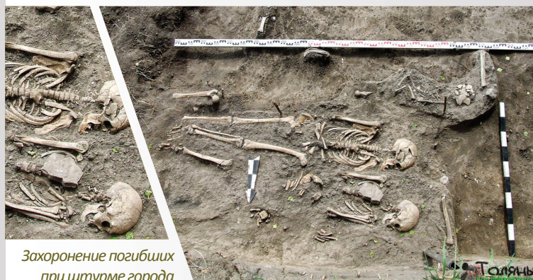
Захоронение погибших при штурме города

На территории засечных лесов Суворовского района и в ближайших окрестностях расположен ряд объектов, представляющих историко-археологическую ценность. Долина Оки издавна заселялась человеком и именно к ней приурочены одни из самых древних для нашей территории поселений – стоянки эпохи мезолита у с. Кулешово и Доброе.