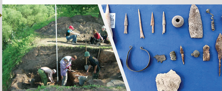
Археологические раскопки в окрестностях г. Чекалина

Характеризуется своеобразной флорой и фауной и наличием большого количества редких видов, занесенных в Красные книги.