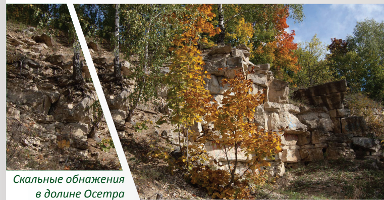
Скальные обнажения в долине Осетра

Еще один хорошо сохранившийся памятник – Грабороновы ворота – оборонительные сооружения Засечной черты XVI–XVII вв. И сегодня крепость демонстрирует передовые приемы фортификационного искусства того времени – земляные укрепления в виде валов, бастионов и редутов. Крепость опоясана широким и довольно глубоким рвом, опирающимся на север на большие леса, остатки которых сохранились по сей день.