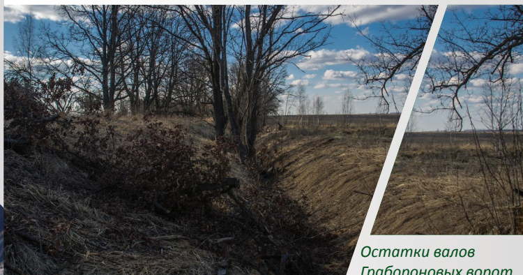
Остатки валов Грабороновых ворот

На одном из самых живописных участков верхнего течения р. Осетр, пересекающего здесь полосу засечных лесов, недалеко от Венев-Никольского монастыря находятся скальные обнажения или, как их часто называют, «скальники». Они представлены высокими вертикальными стенками заброшенного каменного карьера и выделяются на фоне крутых покрытых лесом склонов речной долины, придавая ландшафту вид скалисто-гористого. Многие связывают их существование с монастырем, считающимся старейшим на Тульской земле. Первое письменное упоминание о нем относится к началу XV в., однако предполагают, что монастырь существовал и ранее и располагался, по образцу Киево-Печерской лавры, в карстовых пещерах на берегу Осетра.